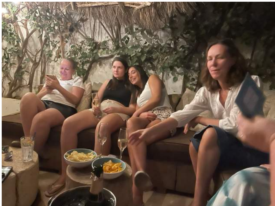
moie vriendschappen en groepsloyaliteit