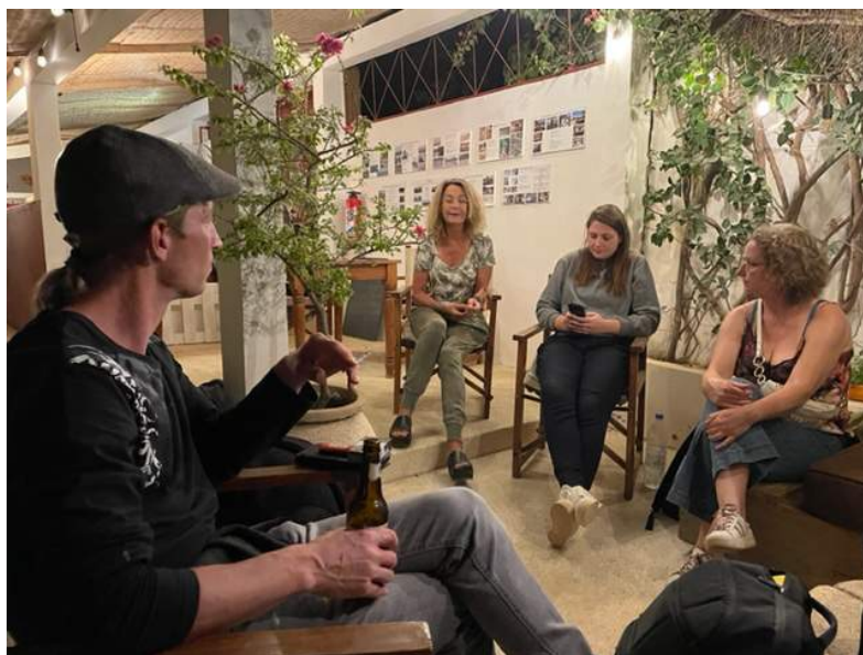
'afscheids'reflectie en bijgebleven 'leer'momenten