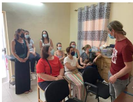
bezoek aan ziekenhuis in Mbour - ontvangst door 'uroloog' 😊 spoeddienst gezien (terwijl men patiënten binnenbrengt...???)