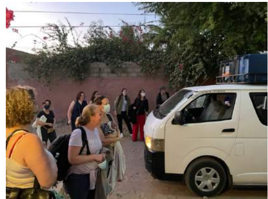
aankomst in B&B