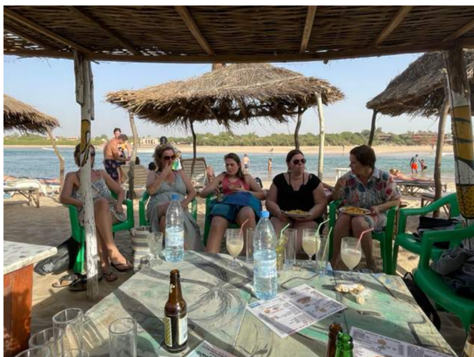
verse oesters tijdens groepsgesprekken 🍷