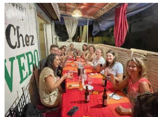
... eerst een drankje en dan nog eentje in een lokaal restaurantje ...