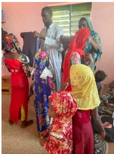
kleedjes doneren aan de weeskinderen