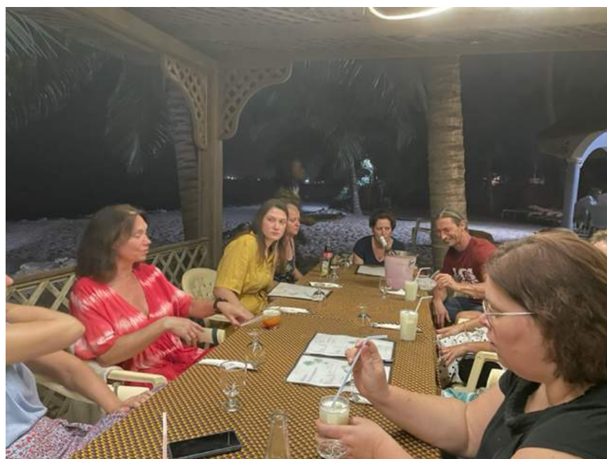
dineetje 's avonds op het strand