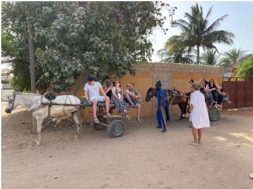
cultuurbad: met paard en kar naar de markt

groeps' reflectie 'momenten en initiatie in de Senegalese cultuur (m.b.t. factoren die de psychologische problemen, bij vooral de Senegalese vrouwen, induceren/faciliteren (familietraditie en -cultuur, Koran-interpretaties, geen opleiding en educatie, corruptie,...))